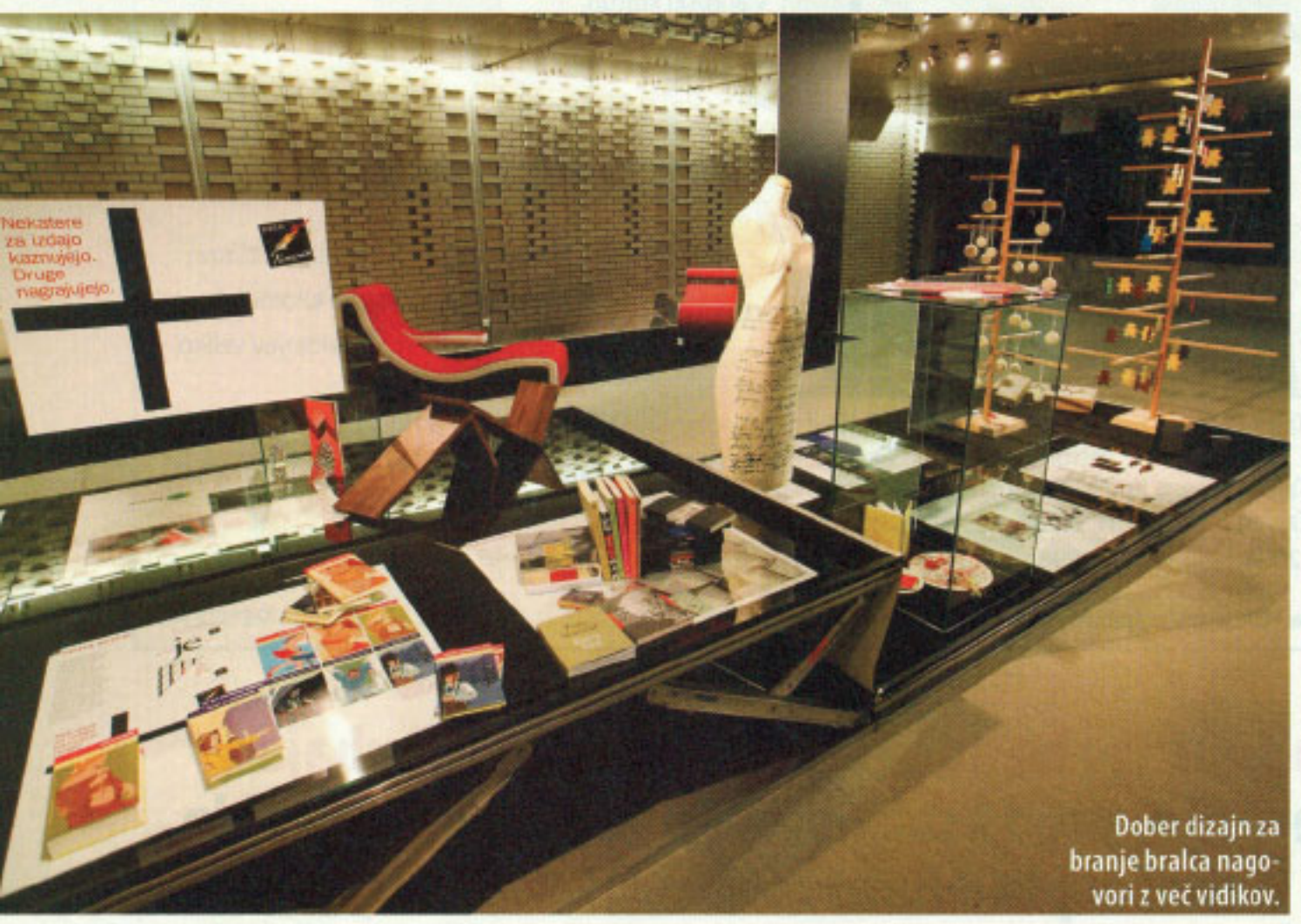
Dober dizajn za branje bralca nagovori z več vidikov.