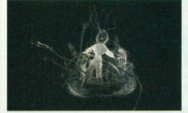
Mali princ, tridimenzionalni objekt, kot si ga je zamislila Ksenija Baraga, ki deluje na področju unikatnega in industrijskega oblikovanja tekstilij, ilustracij in oblikovanja postavitev razstav.