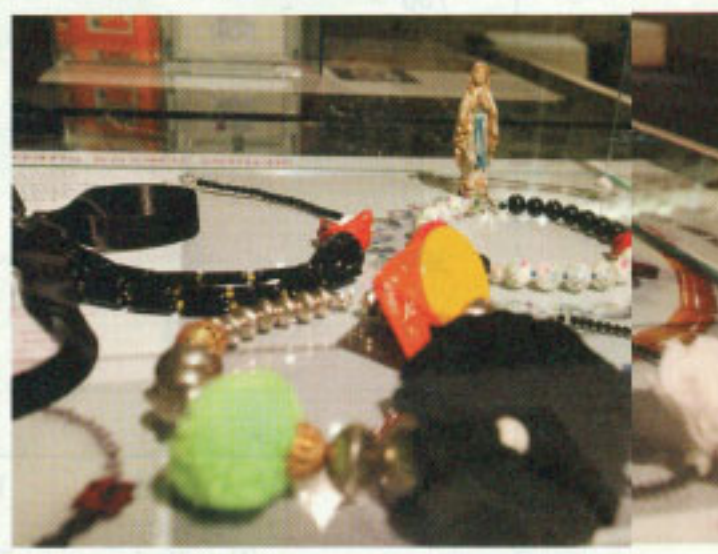
Dela oblikovalke Bojane Kovačič Zemljč