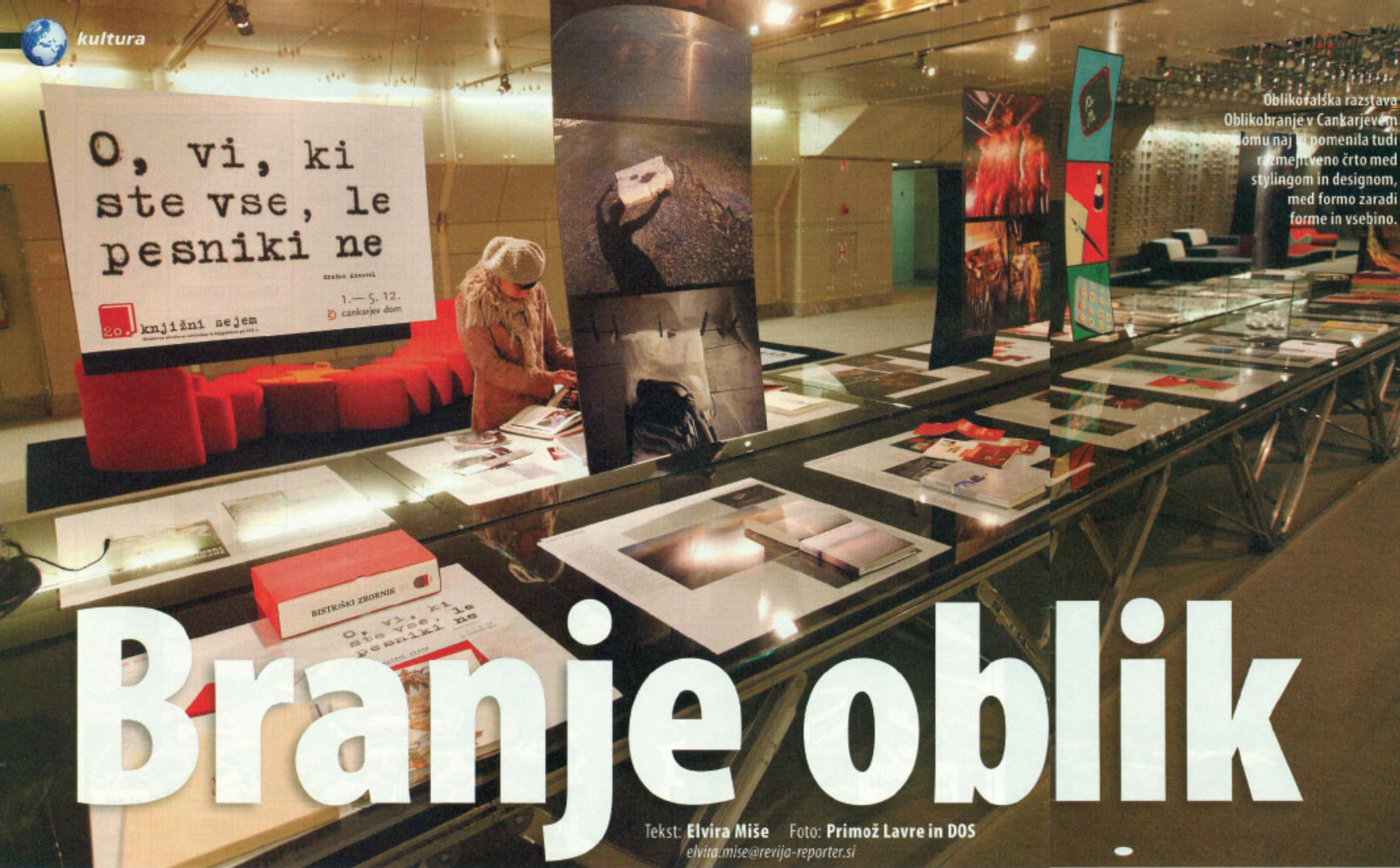
Oblikovalska razstava Oblikovanje v Cankarjevem domu naj bi pomenila tudi razmejitveno črto med stylingom in designom, med formo zaradi forme in vsebino.