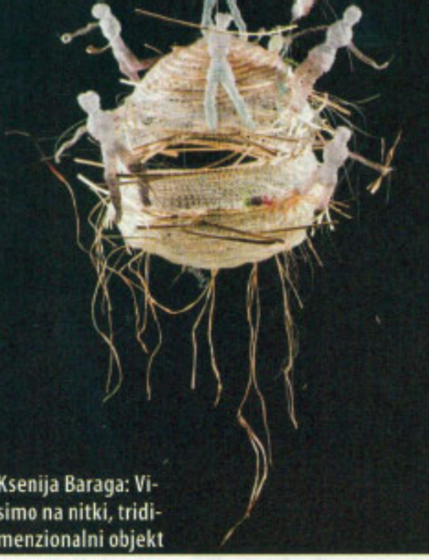
Ksenija Baraga: Vismo na nitki, tridimenzionalni objekt