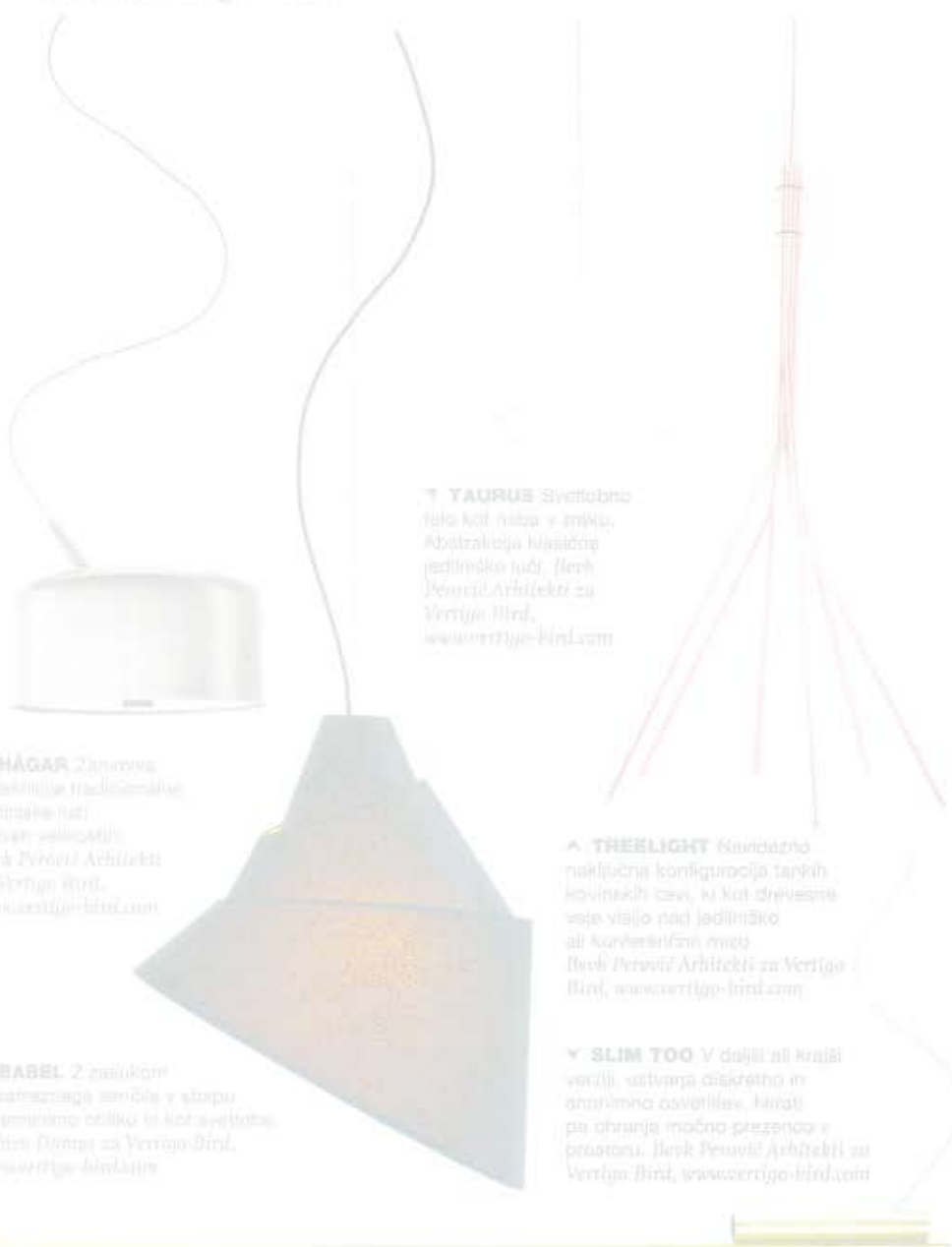
↑ TAURUS Svetlobno telo kot riba v žilku. Abstrakcija klasične jedilniške luči. Berk Perovič Arhitekti za Verigo Bird, www.verigo-bird.com

H.O.M.E. predstavlja sveže nove luči slovenske blagovne znamke Verigo Bird.