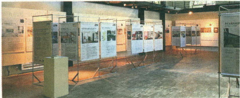
DC Mala Ulica, Ljubljana, arhitektki: Mateja Panter in Špela Kuhar (2011–2013)