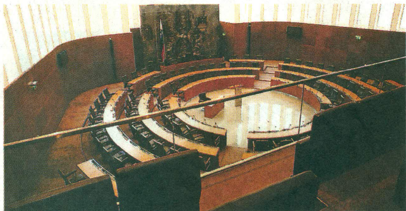
DZ Republike Slovenije, arhitektke: Sonja Miculinič, Darja Valič in Albina Kindlhofer (1998–2000)