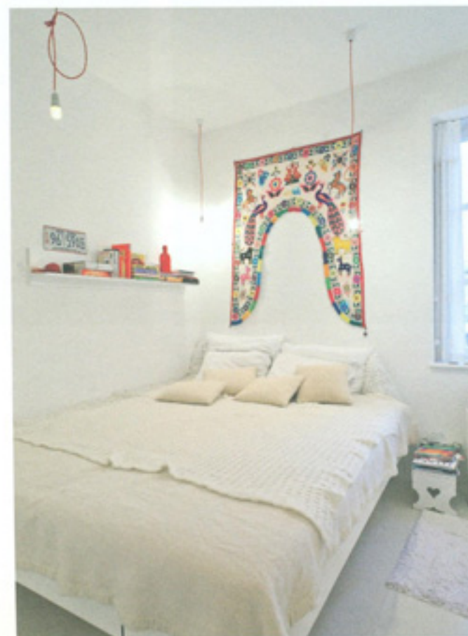
Spalnica je preprosta, majhna, a kljub temu udobna in domiselna.