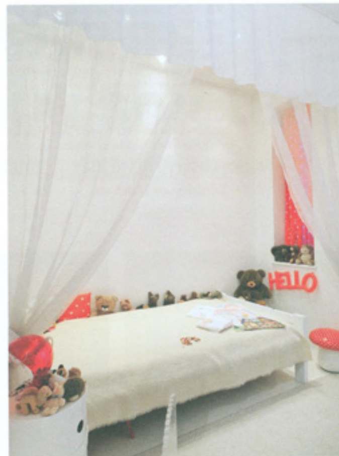
Otroško sobo, belo v osnovi, Gaja vsak dan dopolnjuje in ji daje svoj pečat.