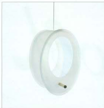
Anka Štular: Ptičnice