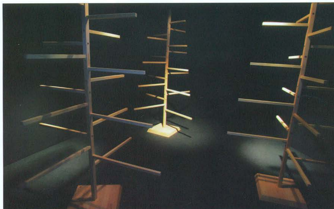
Pavla in Jaka Bonča: Smrekca.180