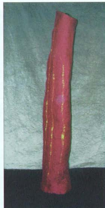
Renata Bedene: polstena svetilka