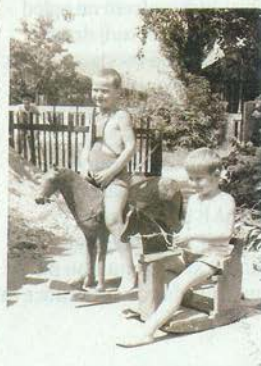
Izvorni konjiček iz leta 1956