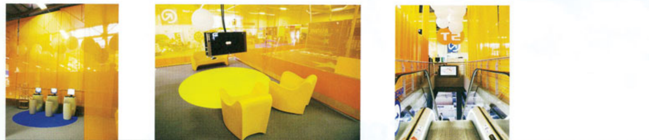
T-2, razstavní prostor, Celje, 2006 in 2007