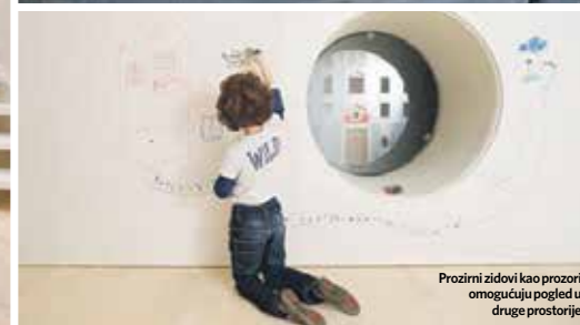
Prozirni zidovi kao prozori omogućuju pogled u druge prostorije